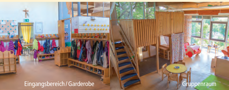
Eingangsbereich / Garderobe

Sagen Sie uns bitte, wenn Sie mit etwas nicht zufrieden sind aber auch gerne, wenn sie zufrieden sind.